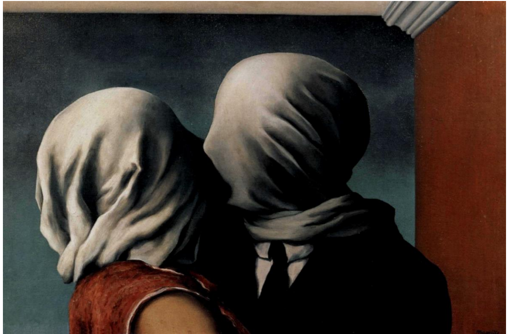
Les amants de Magritte

Association Lacanienne Internationale Bretagne